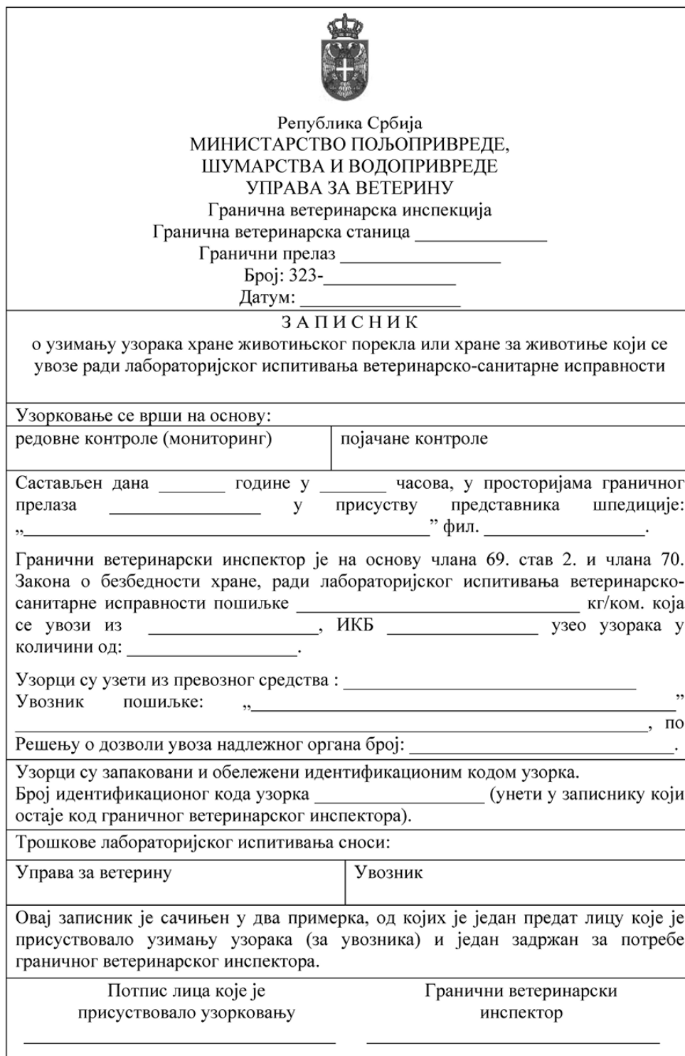
Табела 3 – Записник о узорковању