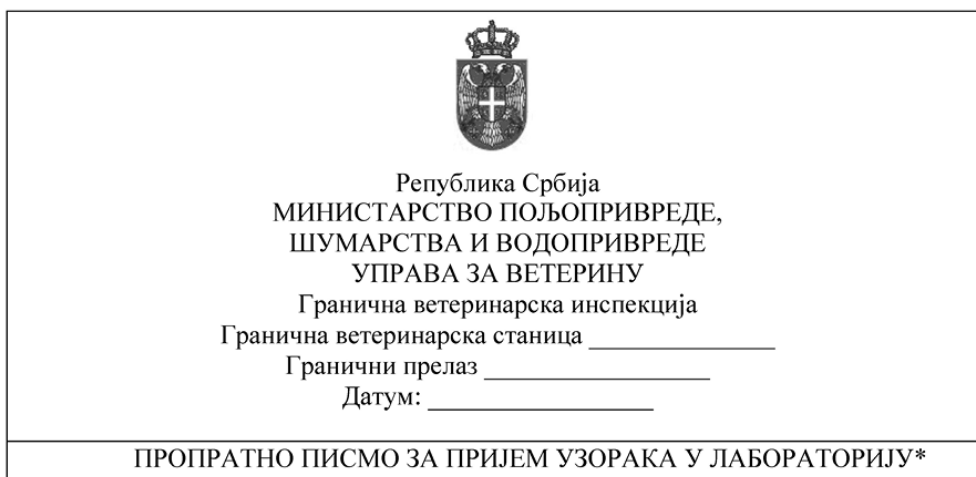
Табела 5 – Пропратно писмо за пријем узорака у лабораторију

Подаци следљивости за узети узорак од стране граничне ветеринарске инспекције, које попуњава гранични ветеринарски инспектор на граничном прелазу: